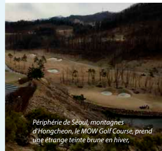
Périphérie de Séoul, montagnes d'Hongcheon, le MOW Golf Course, prend une étrange teinte brune en hiver,

pour la sécurité. Ils disposent également de simulateurs capables d'offrir les plus beaux parcours du monde. Ils jouent là des parties en équipes. Et les tapis sont mouvants afin de reproduire les pentes des terrains. Ce n'est peut-être pas aussi bien qu'un vrai golf, mais ce sont de beaux équipements tout de même. Index 18,5, Sonia essaie de perfectionner son golf sur ces parcours magnifiques quand elle a l'opportunité de les jouer. D'ailleurs, à l'heure où nous publions cet entretien, elle est déjà repartie en Afrique du Sud. Ensuite, elle pense faire un saut à Dubaï où, c'est certain, les pro shops pourront certainement trouver des acquéreurs pour les putters Argolf et surtout pour le petit dernier, le «Graal».