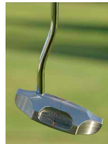
Le nouveau putter de la marque, le modèle Graal est en titane massif découpé au laser. C'est le fleuron de Argolf qui fait entrer le constructeur breton dans le monde fermé des créateurs de luxe.